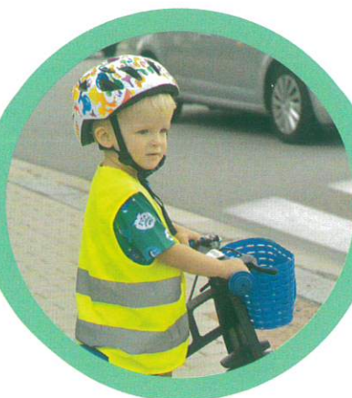
Správné vidění zdravých očí