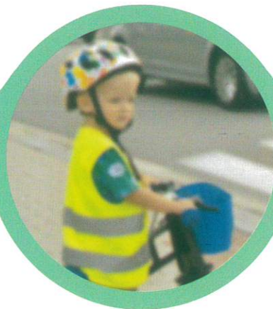
Špatné vidění při dioptrické vadě